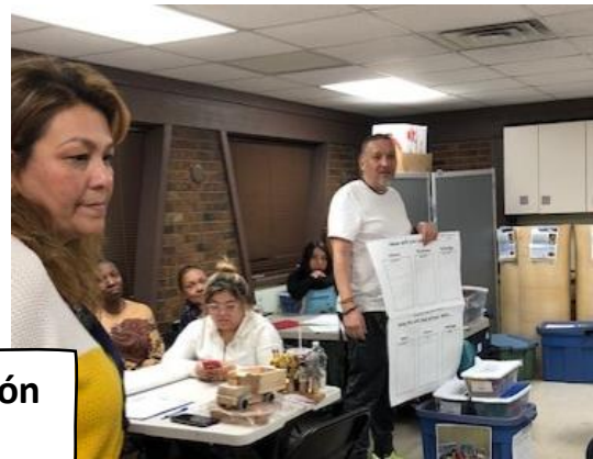
Currículo en Acción Formación 15 de febrero