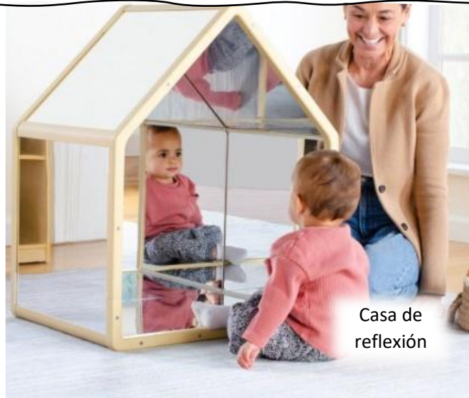
Casa de reflexión