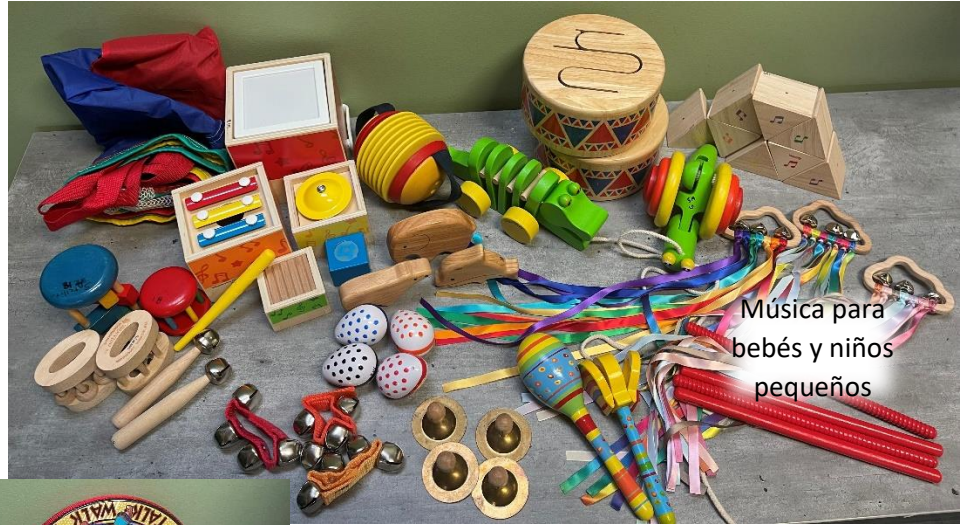
Música para bebés y niños pequeños