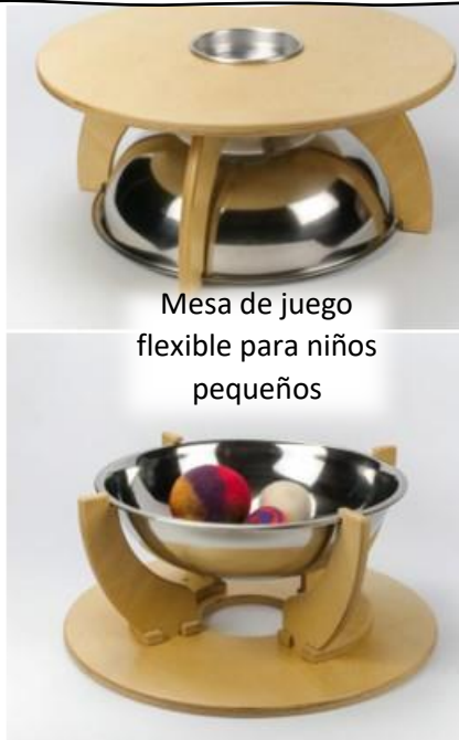
Mesa de juego flexible para niños pequeños