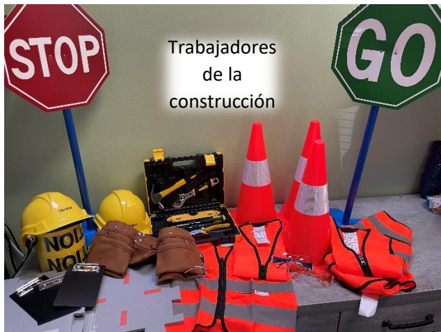
Trabajadores de la construcción