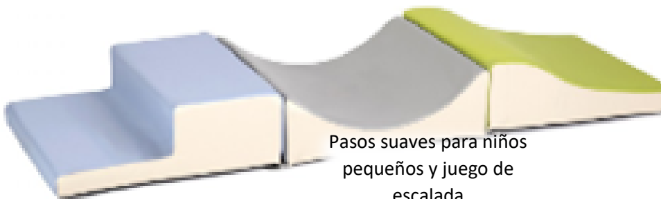
Pasos suaves para niños pequeños y juego de escalada