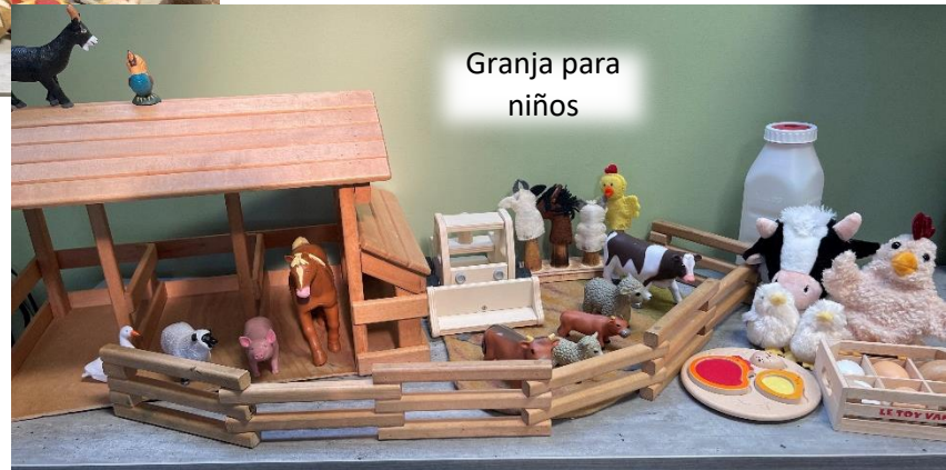
Granja para niños