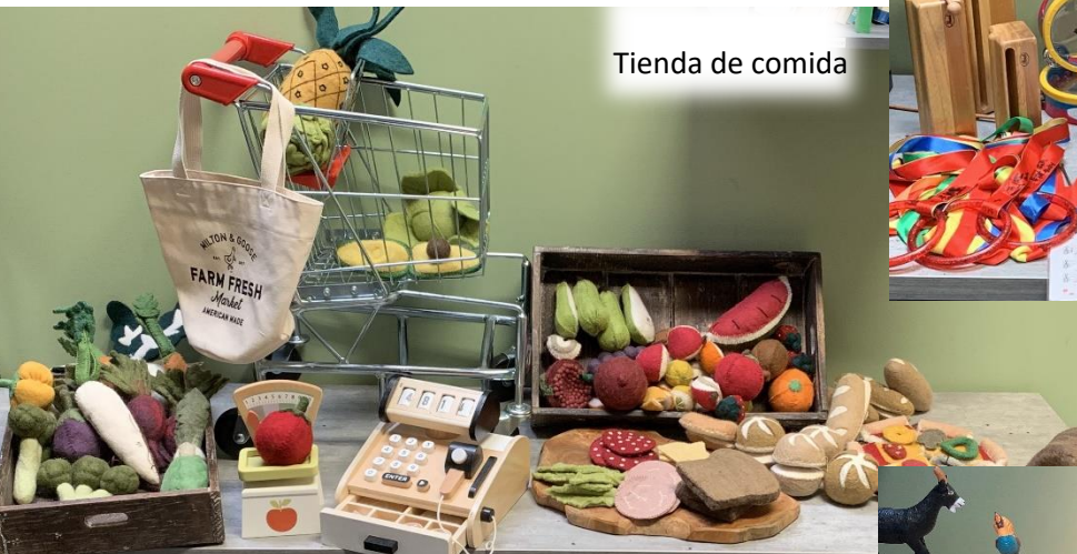
Tienda de comida

UNIDADES CURRICULARES NUEVAS Y ACTUALIZADAS Enlace a la lista de unidades y equipos