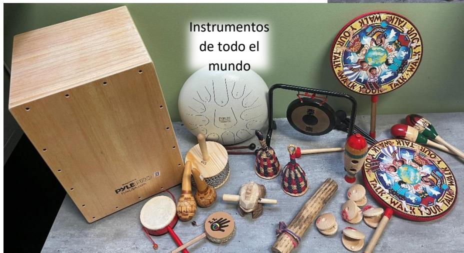
Instrumentos de todo el mundo

UNIDADES CURRICULARES NUEVAS Y ACTUALIZADAS Enlace a la lista de unidades y equipos