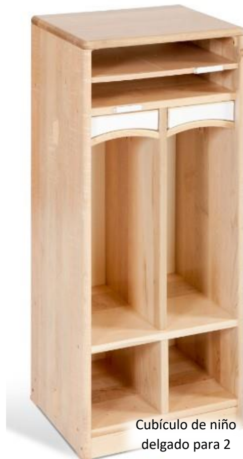
Cubículo de niño delgado para 2