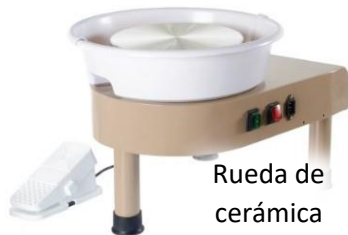
Rueda de cerámica