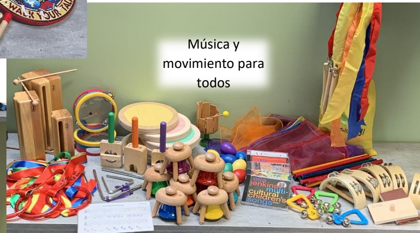
Música y movimiento para todos