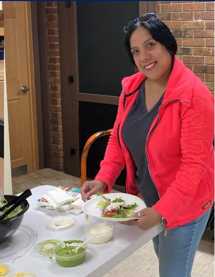
Noche de proveedores latinos 15 de marzo